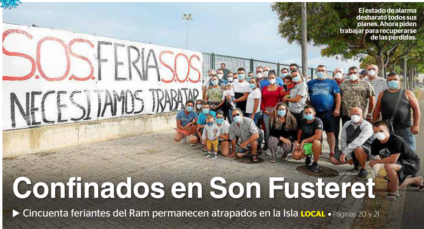
El estado de alarma desbarató todos sus planes. Ahora piden trabajar para recuperarse de las pérdidas.