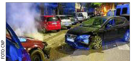
Los vehículos sufrieron daños.

Embiste al coche de policía que lo había multado en Son Gotleu