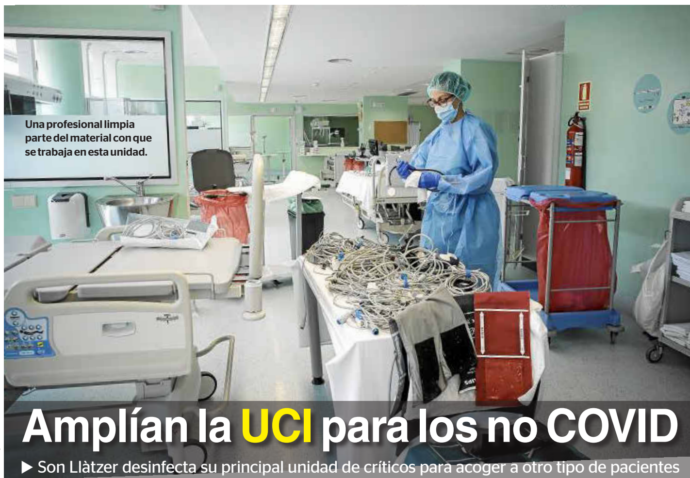
Una profesional limpia parte del material con que se trabaja en esta unidad.

Embiste al coche de policía que lo había multado en Son Gotleu