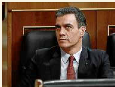
Pedro Sánchez, ayer en la sesión del Congreso de los Diputados.