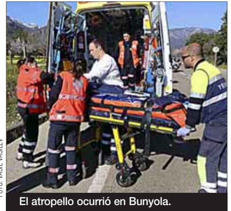
El atropello ocurrió en Bunyola.