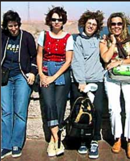
Imagen de las cuatro mallorquinas.