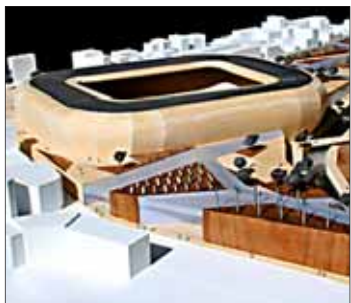
Detalle de la maqueta del nuevo Sitjar.

El Mallorca exhibe su megalómano proyecto para el Lluís Sitjar, que costaría 200 millones