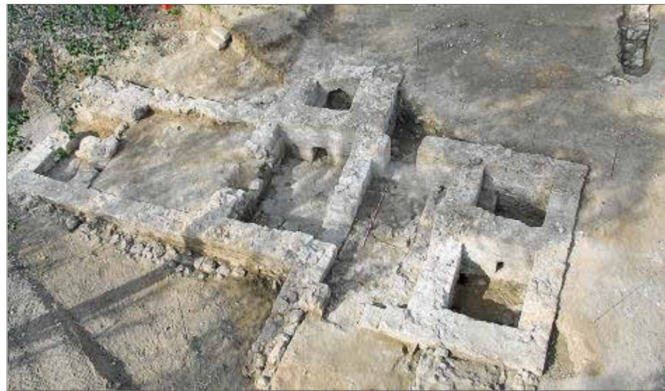
Imagen de los restos de las termas romanas localizadas en 2012.

Los vecinos de Son Servera, tras muchos años de espera, ya podrán utilizar, a partir de mañana, la piscina climatizada así como las nuevas instalaciones del polideportivo municipal de Es Pinaró. Ayer por la tarde, la empresa que ha asumido la gestión del complejo por un periodo de 25 años, Rad Investment, hizo la inauguración oficial a la que asistieron las autoridades locales y una multitud de serverins. (...)