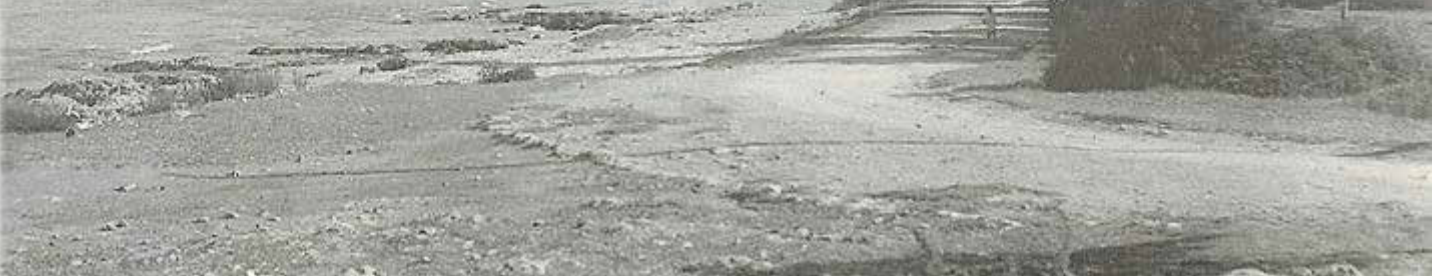
Cala Millor antes de su urbanización en la década de 1930.

1936 El periódico reflejó el desembarco de Bayo