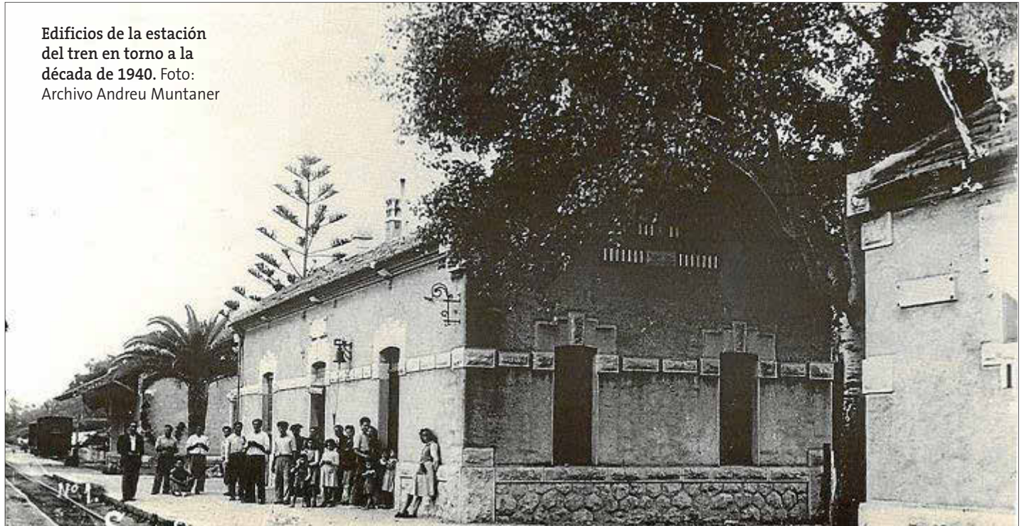
Edificios de la estación del tren en torno a la década de 1940.

(...) Las filas de quienes irrumpieron en nuestras costas se han aclarado tanto, que apenas quedan ya levísimos, inmensamente débiles, focos desperdigados por tierras de la localidad de Son Servera, en donde son perseguidos y cazados como ellos se merecen: como dañinas alimañas. Y paso a paso van acercándose al mar, perseguidos a cortísima distancia por las fuerzas admirables del Ejército y por las compañías de milicias, cuyo mayor contingente corresponde a Falange Española.