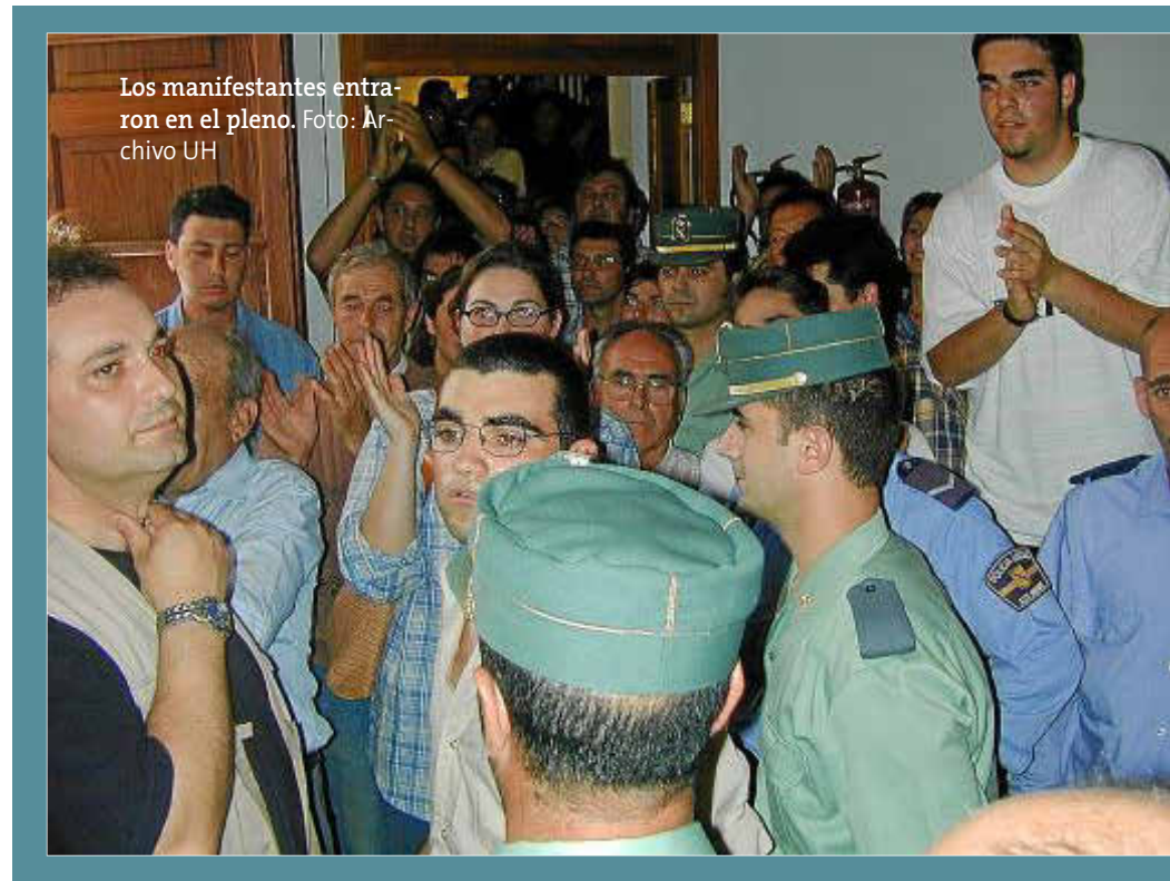
Los manifestantes entraron en el pleno.

La habitual tranquilidad que reina en la industrial localidad de Artà se vio turbada por un suceso que a todos ha conmovido porque en él un hombre ha perdido la vida. Fue en la noche del sábado cuando circuló una