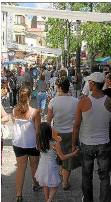
La fira de Sant Joan empezó a celebrarse en el municipio en 1997.

ca en la fecha oficial de la apertura del curso (...).