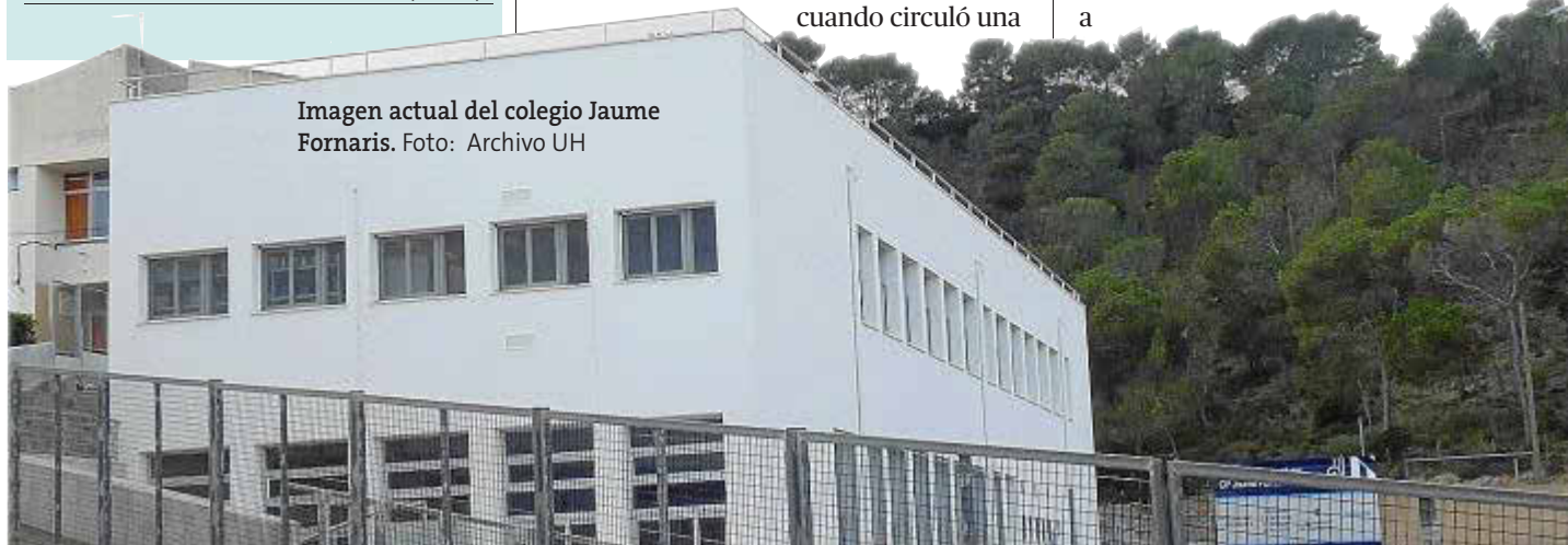
Imagen actual del colegio Jaume Fornaris.