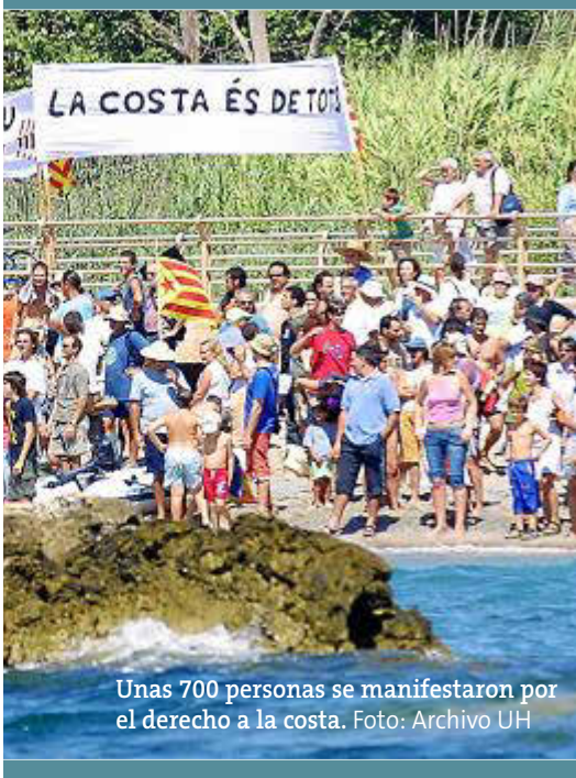
Unas 700 personas se manifestaron por el derecho a la costa.