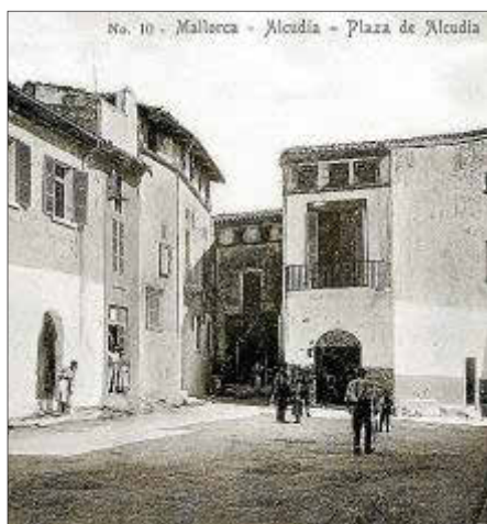
Plaza de la Constitució o plaza Major hacia 1910.

do del mar con lesiones de importancia en el cuerpo. Y finalmente, zozobró un bote tripulado por dos individuos que conducía a bordo del vapor sueco Ostankvik , anclado en el puerto de Alcúdia al joven don Francisco Crespí, con tan mala suerte, el accidente, que solo se consiguió salvar a los dos citados tripulantes desapareciendo el señor Crespí. A pesar de las pesquisas que se han hecho para dar con el desgraciado joven nada ha podido conseguirse (...).