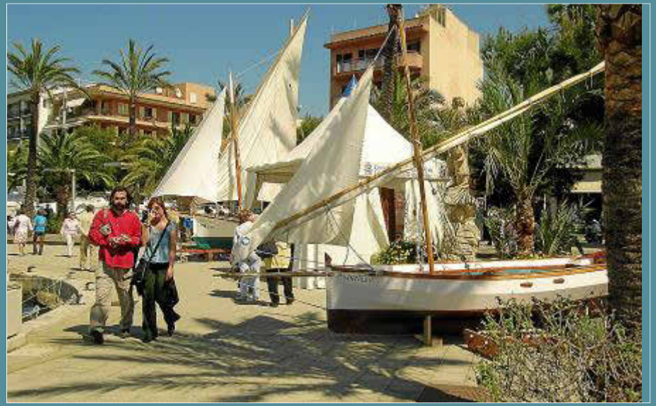
La feria Nàutica y la Mostra de la Sípia se celebran desde 2006.

desde la base de Portopí y que fue uno de los más admirados. También despertó gran expectación La Balear, una barca de bou restaurada por la escuela de mestres d'aixa del Consell. La muestra náutica se complementa con los mejores platos de degustación realizados especialmente en las cocinas de 27 restaurantes colaboradores, todos ellos con la sepia como ingrediente fundamental y es que según explicó el alcalde Miquel Ferrer, «es un producto típico de la bahía de muy buena calidad y de temporada, por lo que reunía los requisitos esenciales para que formara parte de la muestra» (...).