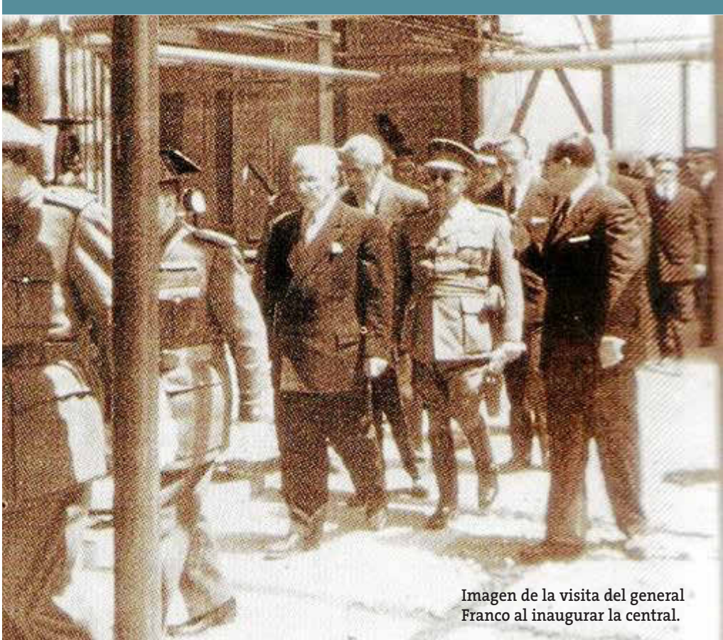
Imagen de la visita del general Franco al inaugurar la central.