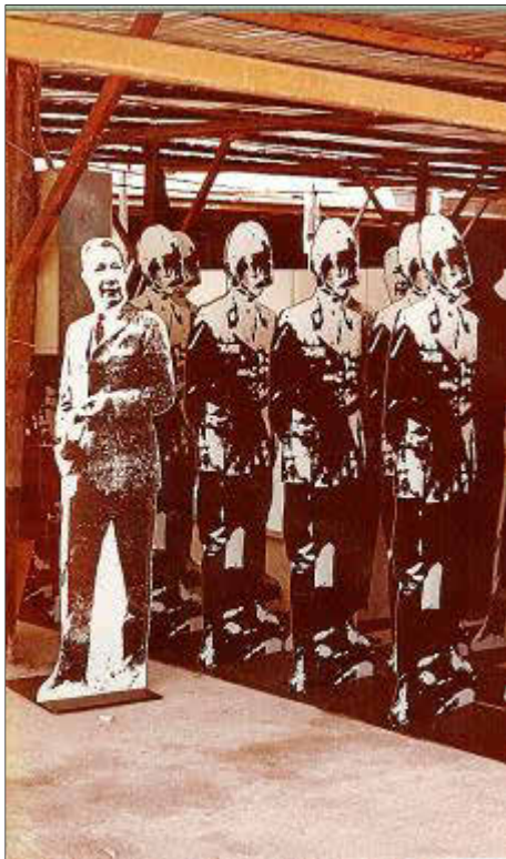
Instalación realizada por Criada 74 y que fue retirada por la Guardia Civil.

do retirada por orden municipal cuando, al parecer, en principio se habían obtenido los permisos necesarios. Los componentes del grupo artístico se han puesto en contacto con nosotros para manifestar que el día 26 decidieron retirarse del Primer Ciclo de Investigaciones Plásticas, por no acceder a la modificación que la autoridad competente pretendía que sufriera la obra presentada.