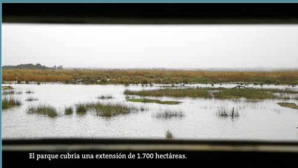
El parque cubriría una extensión de 1.700 hectáreas.