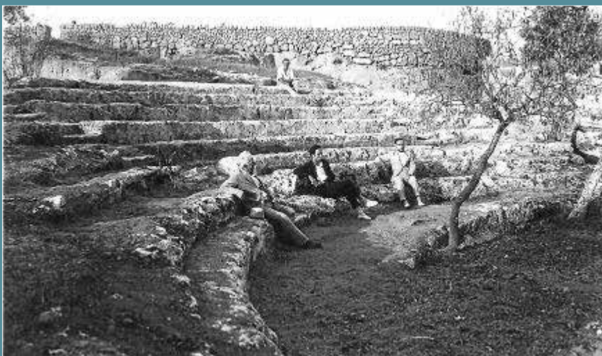
Pol·lèntia en los años veinte del pasado siglo, Gabriel Llabrés sentado con unos compañeros de trabajo.

pueda ver la perfección de su estilo. Al lado del sitio en que se halló hay emplazados tres basamentos cuadrados que parecen ser el asiento de estatuas o lápidas sepulcrales. También han sido descubiertos a unos ocho palmos de profundidad, una estatuilla completa de bronce, de unos 35 o 40 centímetros: un áspid o «esculapio» y una verja imitando un ramo, todo de bronce.