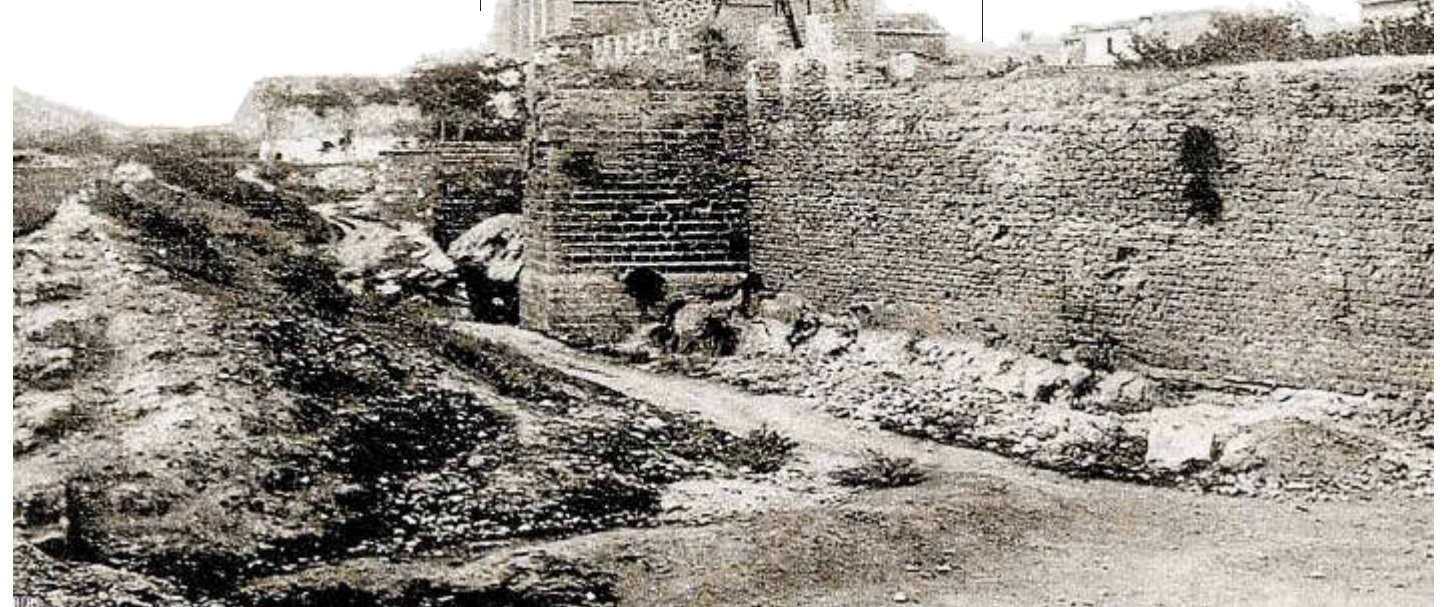
Imagen de las murallas de Alcúdia hacia 1910.

ta del naufragio acaecido en el puerto de aquella ciudad en la noche del jueves. El escampavía Pez encontró ayer por la mañana a unas dos millas al norte del cabo Ferrutx al laud de pesca San Diego completamente abandonado y sin ninguno de los marineros que lo tripulaban, por lo que se cree con fundamento que habrán perecido ahogados por efecto de la borrasca que se desencadenó en la noche del suceso. Esta desgracia ha causado honda impresión en el pueblo de Alcúdia y se hacen toda clase de esfuerzos para encontrar a los naufragos.