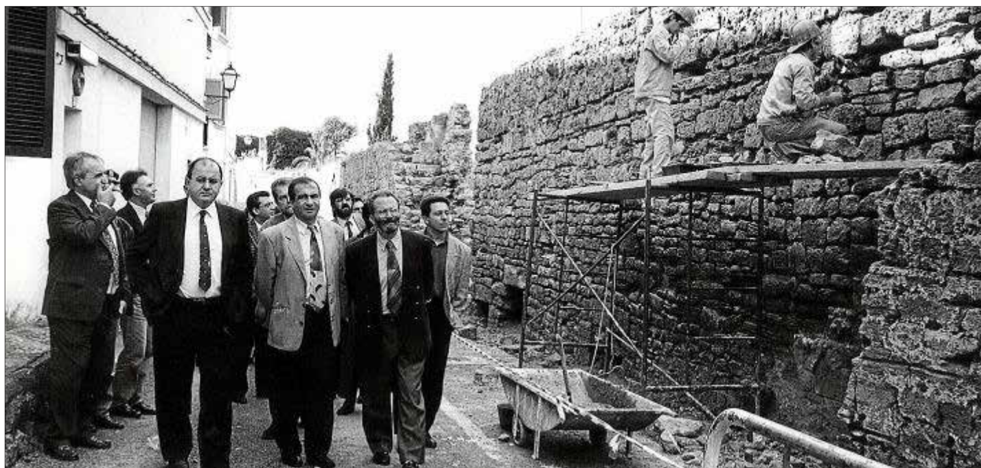
Autoridades visitando las obras de rehabilitación de las murallas de Alcúdia.

Parte de las murallas de Alcúdia que están siendo restauradas se desmoronaron ayer tarde en una extensión de veinticinco metros. Dos obreros que se hallaban trabajando en aquellos momentos sufrieron heridas de consideración.