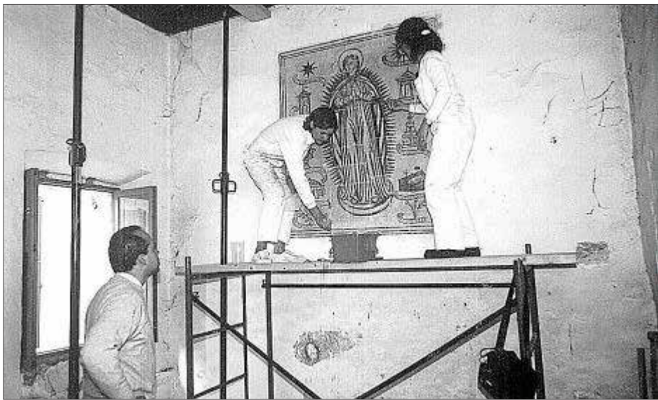
La restauración de Can Fondo empezó por preservar los frescos.

cinco años después de su nacimiento, ahí lo tienen, abandonado a su suerte.