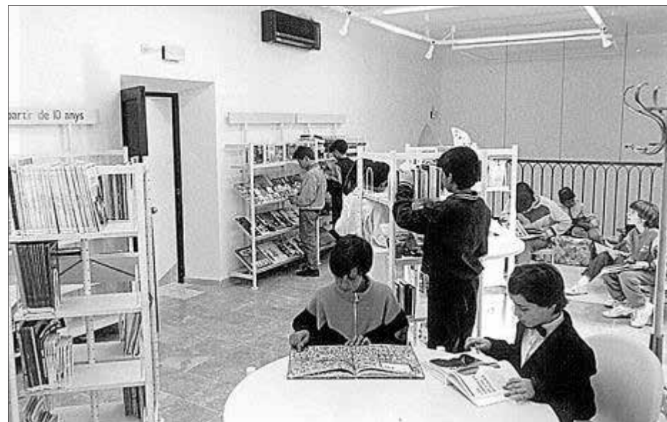
La biblioteca de Can Torró abrió sus puertas al público en 1990.

CULTURA La fundación Bryan cedió el teatro de Pol·lència