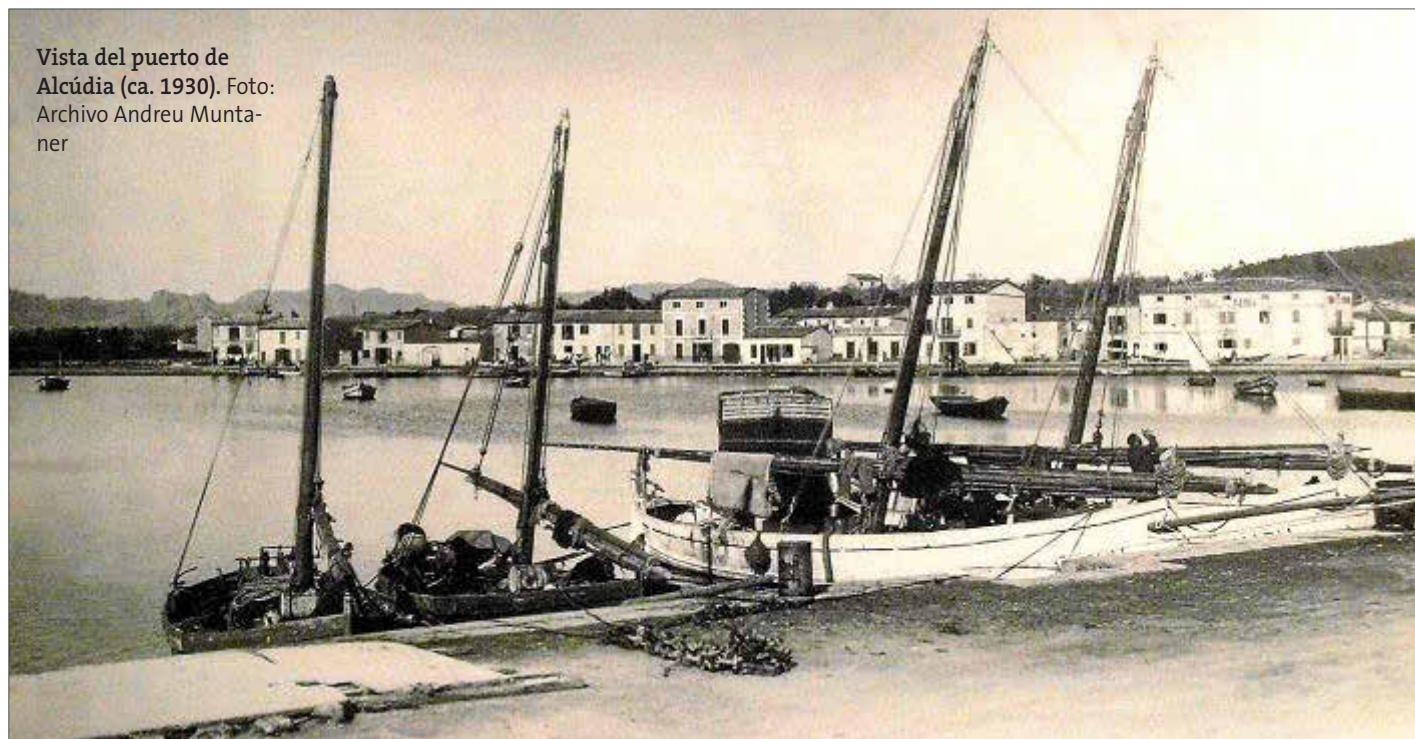
Vista del puerto de Alcúdia (ca. 1930).

EPIDEMIA La epidemia de la gripe de 1918 provocó pocas muertes