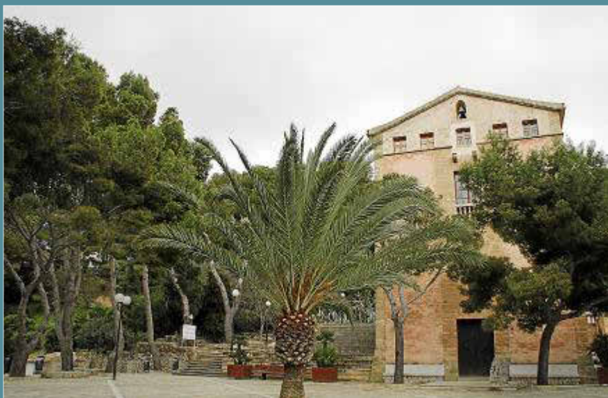
Los grandes buses no pueden llegar más allá del albergue juvenil.

valor medioambiental. El alcalde denunció en el último pleno los «excesos» y «abusos» que se producen en el comedor de la Victoria y en la zona de merenderos de s'Illot visitados por numerosos turistas, pero cuyos gastos de mantenimiento sufraga íntegramente el Ajuntament. El Consistorio ha detectado la presencia de grupos organizados de excursionistas que acuden a la Victòria acompañados de un guía y hacen uso de las instalaciones de la cocina y el comedor sacando un uso lucrativo. La restricción a los autocares en la Victòria entrará en vigor de forma inmediata una vez se instale la señalización.