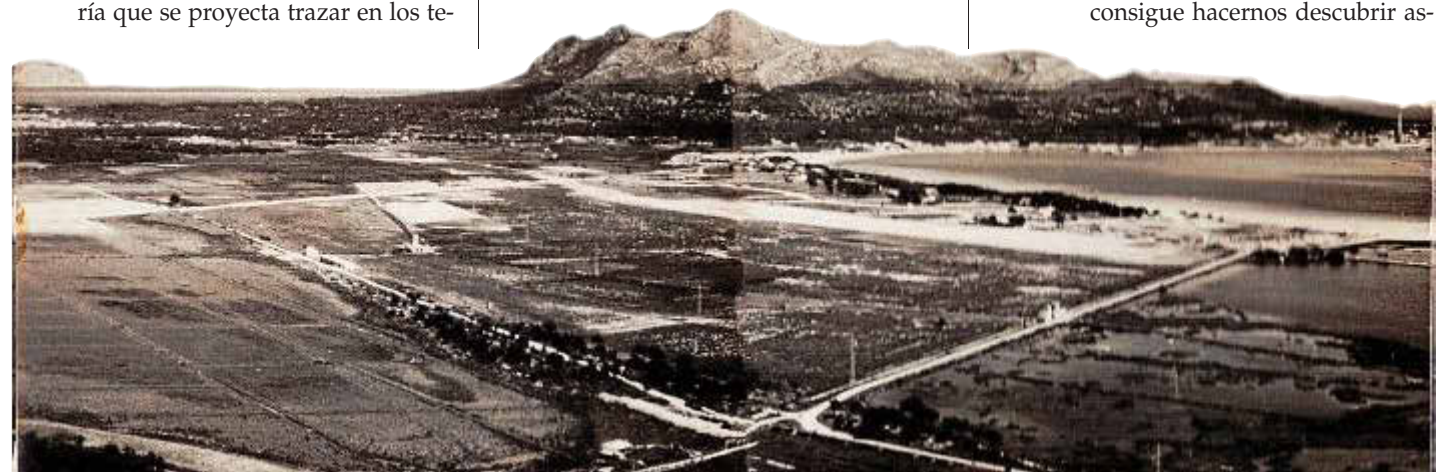
Panorámica del litoral de Alcúdia, hoy urbanizado, de finales de los años cincuenta.

ALGEBELÍ En 1969 se inauguró la urbanización de Alcúdia