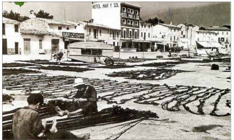
El puerto de Alcúdia a finales de la década de 1940.