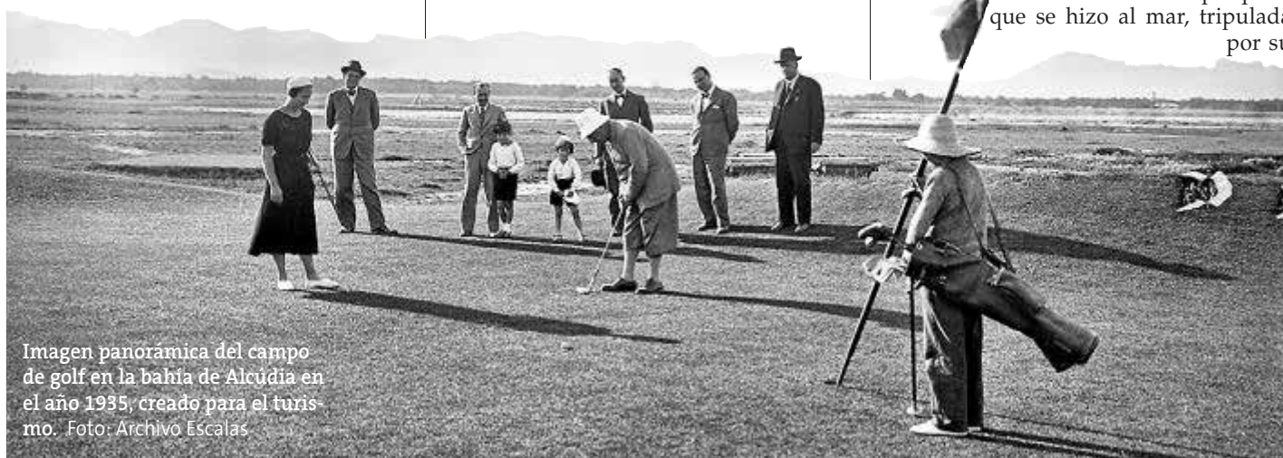
Imagen panorámica del campo de golf en la bahía de Alcúdia en el año 1935, creado para el turismo.