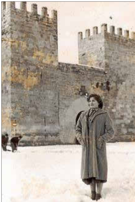
La nieve alcanzó un espesor de 50 centímetros.

(...) Muy cortesmente la Alcaldía de Alcúdia contesta a nuestras preguntas acerca de la nevada. En primer lugar nos dicen que la nieve alcanzó y mantiene un espesor de 50 centímetros cubriendo totalmente las calles y alrededores. No son ciertos los rumores que circulan acerca de los estragos que la nevada haya podido causar en los almendros. De momento es prematuro afirmar nada en este sentido ya que tendrían que soplar fuertes vientos en estos días de fusión y entonces sí sería incalculable los daños de esta nevada sobre los almendros. No se recuerda ni por los más viejos otra nevada asolada Alcúdia. Aquí ayer el ritmo de la vida quedó completamente alterado. La sorpresa de encontrarse con Alcúdia completamente nevada llamó la atención a jóvenes y viejos. Las comunicaciones han quedado interrumpidas en parte. Ayer al coche de Inca llegó tras una travesía difícil. No así el directo de Palma que suspendió del viaje, prudentemente.