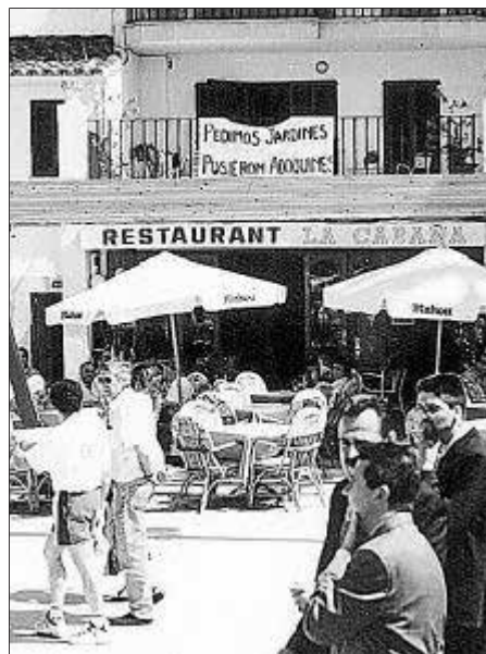
Imagen de una pancarta en el paseo Marítimo.

construcción de unas 500 viviendas, lo que supone una capacidad para 1.600 personas. La decisión fue apoyada por los partidos del pacto de progreso del CIM, PSOE y UM, los dos partidos que precisamente en Alcúdia han defendido la desclasificación de este urbanizable. (...).