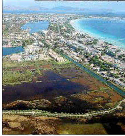
La urbanización de la localidad y el cierre de las playas levantó cierta polémica.