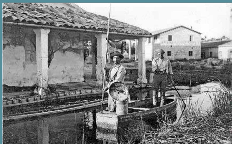
Pescadores en la Albufera de Alcúdia a principios de siglo XX.