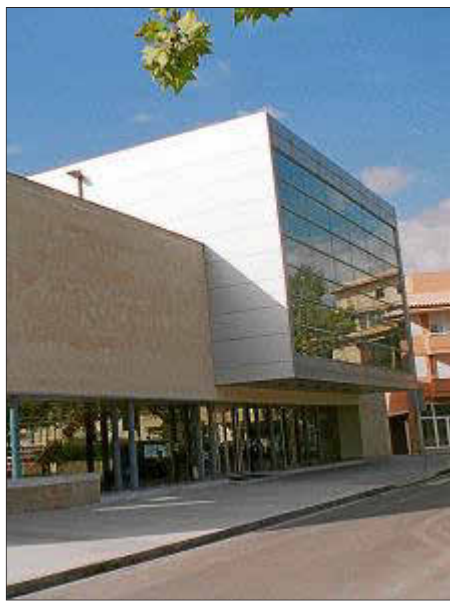
El edificio del Auditorium.

una sala polivalente para impartir conferencias.